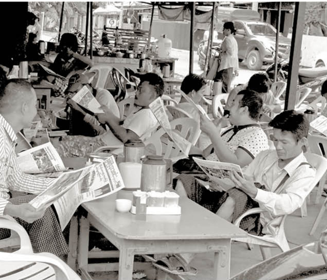
စာဖတ်ပရိသတ်များ ဖတ်ရှုနေစဉ်

သော ပုံစံကြောင့်ပင် သတင်းခန်းကို နေ့စဉ်စီမံရသောစိတ်ဖိစီးမှုများနှင့် စိန်ခေါ်မှုများကို ကျော်ဖြတ်ရာတွင် အထောက်အကူပြုသည်ဟု သူပြောသည်။