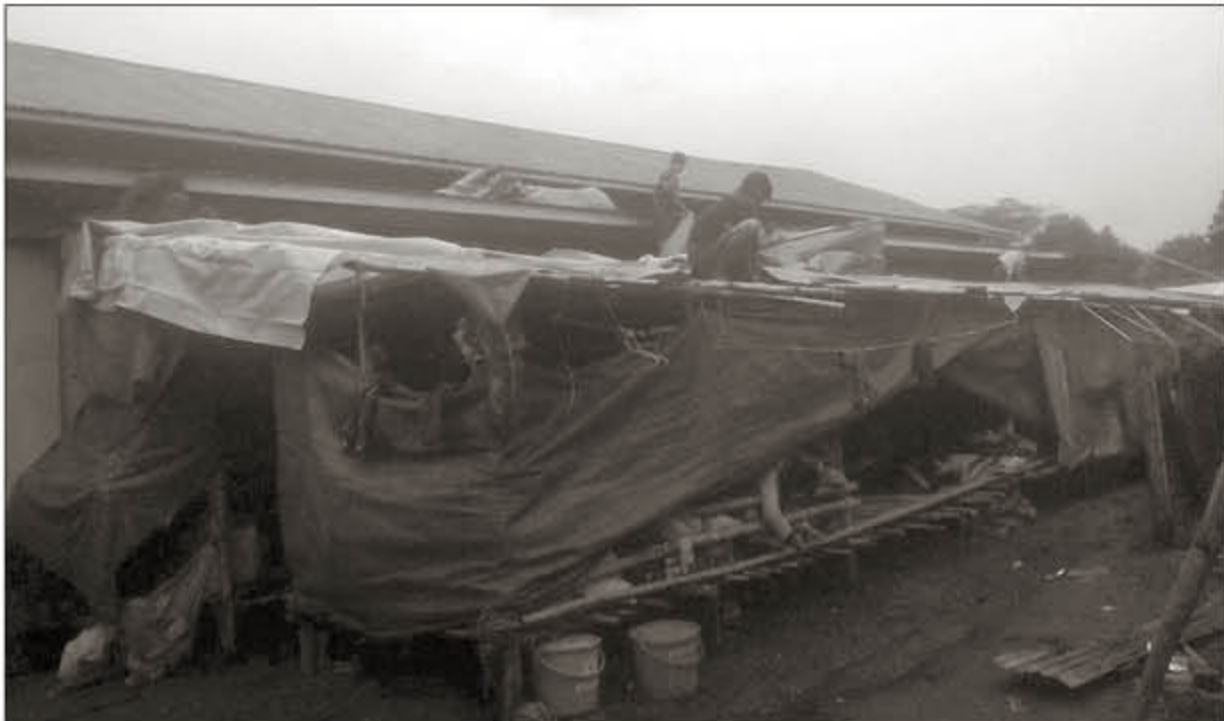
တနိုင်းနှစ်ခြင်းဘုရားကျောင်းရှိ စစ်ရှောင်စခန်းများ ပျက်စီးနေပုံ