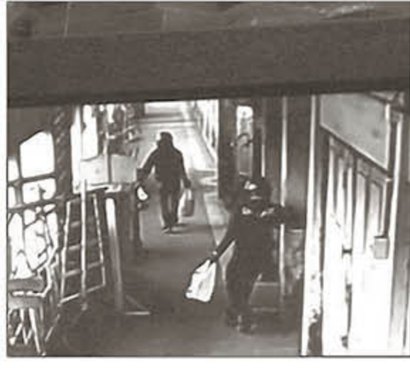
မြစ်ကြီးနားမြို့ စည်ပင်သာယာမြို့မဈေး (၁) A အပေါ်ထပ်ရှိ KBZ ဘဏ်ခွဲ(၁)၌ ငွေကျပ်သိန်း ၉၂၀ ခန့်နှင့် CCTV စက်လုယူခံရမှု

ကမ္ဘောဇမိနီဘဏ်အား ဓားပြတိုက်လုယက်ခြင်းကို လူ ၄ ဦးက ပြုလုပ်ခဲ့ခြင်းဖြစ်ပြီး ထိုသူများသည် အသက် ၂၀ နှင့် ၂၅ နှစ်ကြား လူငယ်များဖြစ်ကြောင်း ဘဏ်ဝန်ထမ်းများ၏ ထွက်ဆိုချက်ကို မြို့မရဲစခန်းမှ