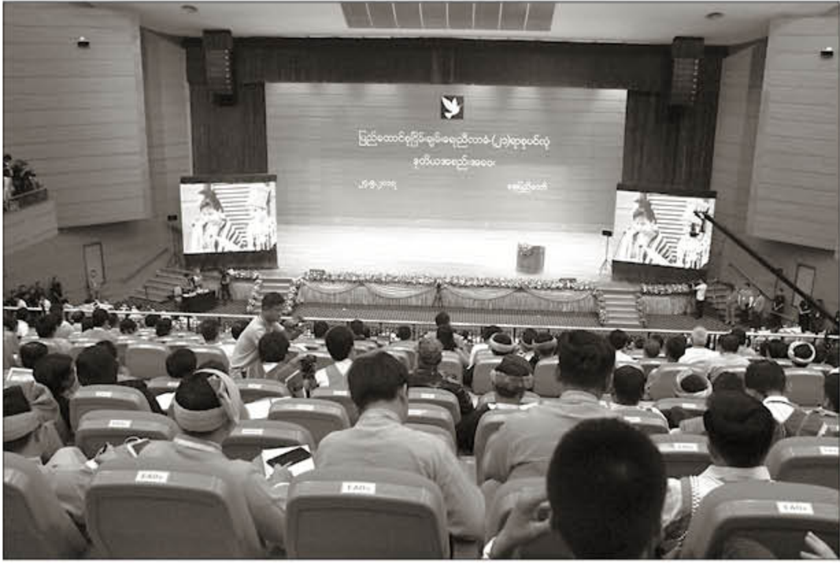
၂၁ ရာစုပင်လုံညီလာခံ ကျင်းပပြုလုပ်နေပုံ