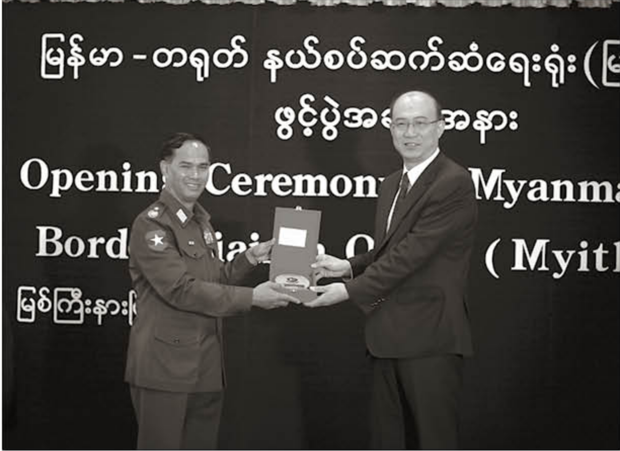
မြန်မာ-တရုတ်နယ်စပ်ဆက်ဆံရေးရုံးဖွင့်လှစ်ပွဲသို့ တက်ရောက်သော ဝိုလ်ချုပ်အောင်စိုး

နှစ်နိုင်ငံ သဘောတူညီချက်အရဖြင့် "မဲခေါင်ဒေသ လုံခြုံရေး" ပူးပေါင်းစစ်ဆင်ရေးပဟိဌာနသို့ မူးယစ်ဆေးဝါး နှိမ်နင်းရေးအရာရှိများ အား စေလွှတ်တာဝန်ထမ်းဆောင်စေခြင်း၊ သတင်းအချက်အလက်များအား ဖလှယ်နိုင်ရန် ပဟိဌာနသို့ ပြည်နယ်/တိုင်းအဆင့် အောက်ခြေအဆင့်ဟူ၍ အဆင့်သုံးဆင့်ခွဲခြားလုပ်ဆောင်ခြင်း၊ တရုတ်နိုင်ငံသားများ ပါဝင်ပတ်သက်