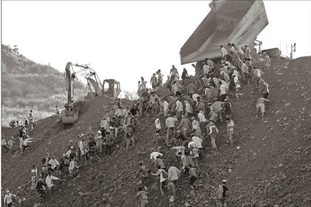
ဖားကန့်ကျောက်စိမ်းကုန်ကုန်မှ စွန့်ပစ်သော မြေစာပုံ

မတ် ၂ ၂၀၁၇ မြန်မာ့ကျောက် မျက်ရတနာ ဥပဒေမူကြမ်းထဲ တွင် ပါရှိသည့်အတိုင်း အကြီး စားလုပ်ကွက်များကို လုပ်ငန်း လုပ်ကိုင်ခွင့် ထပ်မံချထားပေး မည်ဆိုပါက ယခု အစိုးရသက် တမ်းအကုန်တွင် ကျောက်စိမ်း တွင်းများ ကုန်ဆုံးသွားနိုင် သည်ဟု ကချင်အမျိုးသား ကွန်ဂရက်ပါတီမှဥက္ကဋ္ဌ ဒေါက် တာ M ကောန်လက ပြော သည်။