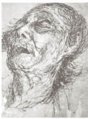
သခင်ကျယ်တော်စိုင်း မင်ခြစ်ပန်းချီ