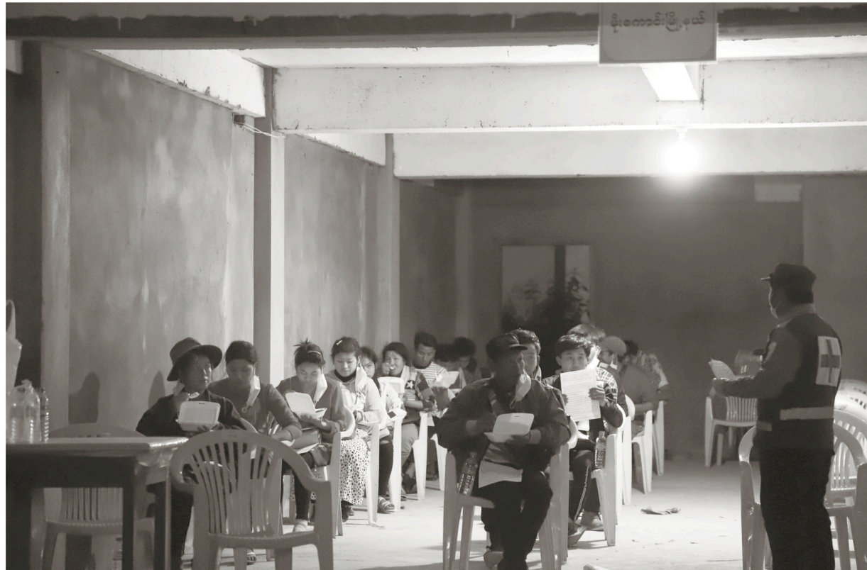
ပြည်တော်ပြန်များကို ခေတ္တနားနေသည့် ကုန်တင်ကုန်ချစခန်းတွင်တွေ့ရစဉ်